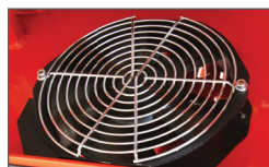
Дополнительный охлаждающий вентилятор