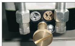
Клапан By pass