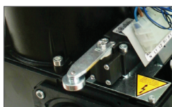
Механический концевой выключатель с рычагом