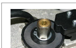
Механическая двухдисковая муфта